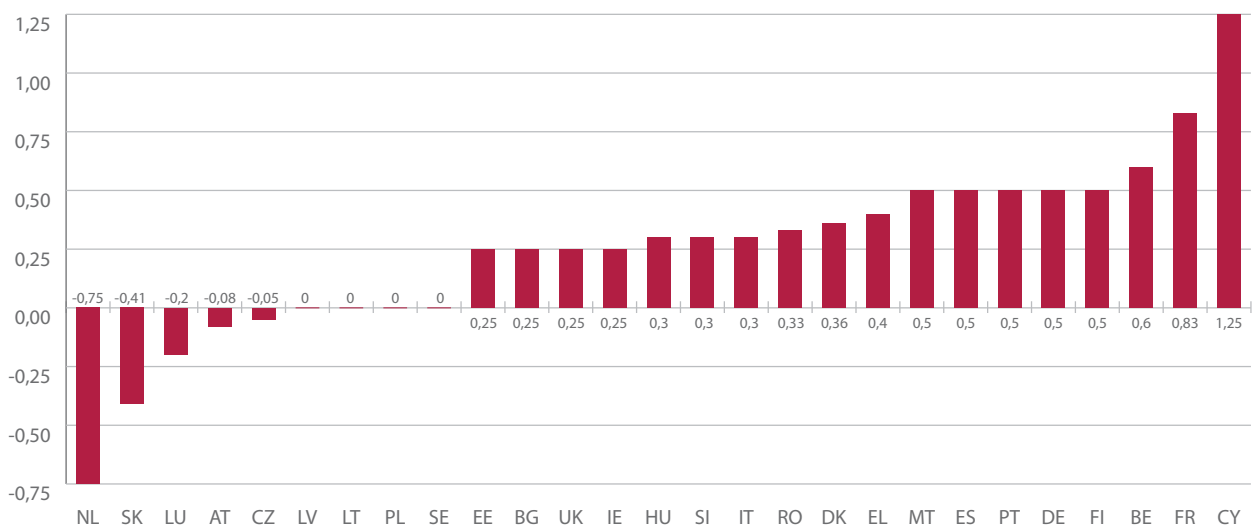
Abbildung 3: Vergleich des Bekanntheitsgrads bei Gewerkschaften und Arbeitgebern, nach Ländern

Für die Interviews wurden außerdem Stelleninhaber mit Zuständigkeiten im Bereich der Bekämpfung von Diskriminierung aus Gründen der Rasse oder der ethnischen Herkunft ausgewählt, und solche Stellen finden sich eher in etablierten Arbeitgeberorganisationen und größeren Unternehmen, die wiederum eher in den EU-15-Mitgliedstaaten anzutreffen sind. Außerdem handelt es sich bei den meisten Ländern, die schon vor 1975 Mitglied der EU waren, um Länder, in denen es zwischen 1950 und 1980 zu einer beträchtlichen EU-internen Migration von im Ausland geborenen Arbeitskräften kam,