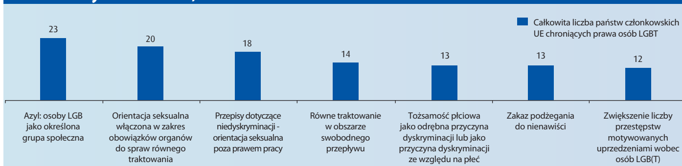
Rys. 2: Prawa osób LGBT w państwach członkowskich: sytuacja prawna w kluczowych obszarach, 2010 r.

Rys. 2 pokazuje zróżnicowanie i nierówności w obszarze ochrony praw osób LGBT, zarówno w kluczowych badanych kwestiach jak i pomiędzy państwami członkowskimi UE. Prezentuje również w kolejności malejącej obszary, w których prawa osób LGBT są najlepiej chronione w państwach członkowskich UE (poza zatrudnieniem, gdzie wszystkie państwa członkowskie zapewniają ochronę ze względu na dyrektywę 2000/78/WE).