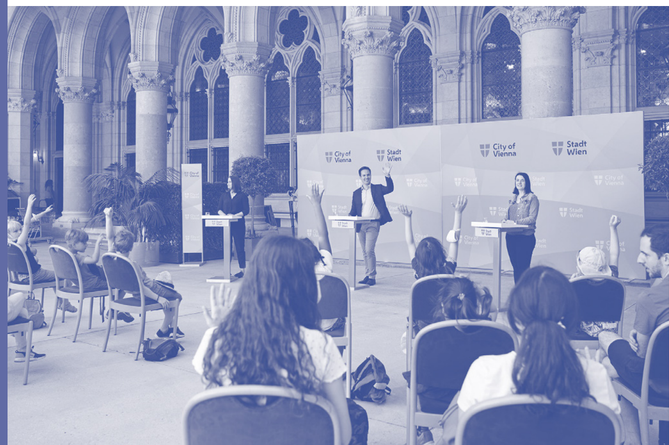
↑ Avstrija, 2021 Dunajski otroški in mladinski parlament.