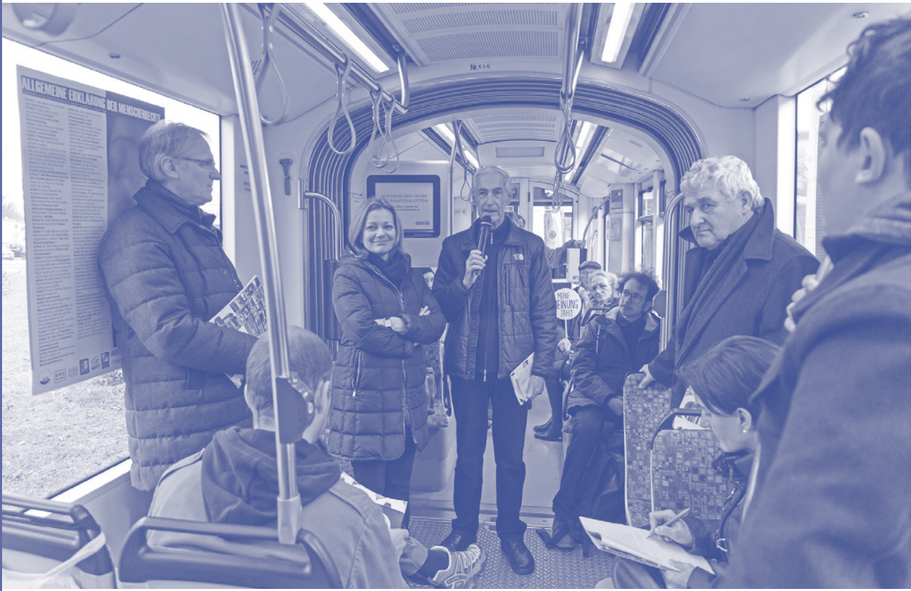
↑ Avstrija, 2019 Dogodek za medije v zvezi s poročilom Gradca o človekovih pravicah.