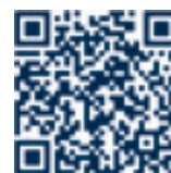
Foto: © iStockphoto; Comissão Europeia; OSCE (Milan Obradovic) © Agência dos Direitos Fundamentais da União Europeia, 2016

Print: ISBN 978-92-9491-274-9, doi:10.2811/107106 PDF: ISBN 978-92-9491-287-9, doi:10.2811/347231