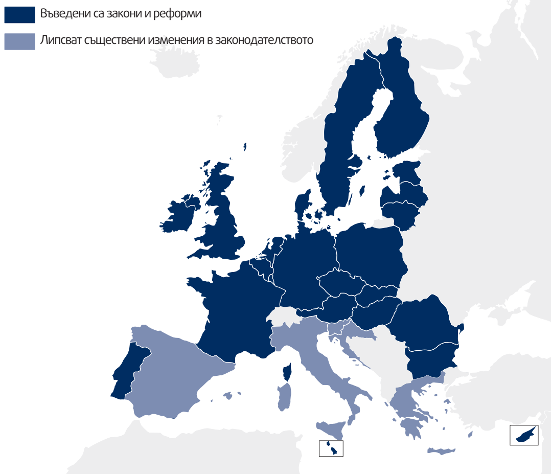
Фигура 1: Правните уредби на държавите – членки на ЕС, в областта на наблюдението, реформирани след октомври 2015 г.