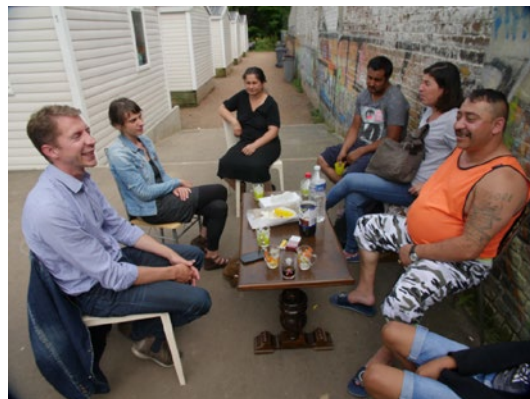
Lille – Sozialarbeiter der Organisation AFEJI nehmen an einer Sitzung der Ausdrucksgruppen außerhalb der Wohnungen der Roma-Familien teil. In den Ausdrucksgruppen konnten Roma ihre Anliegen, Bedürfnisse und Ideen zum Ausdruck bringen

greifbaren – wenn auch noch so kleinen – Nutzen für die Menschen erzeugen, sind eine Möglichkeit, die Teilnahme an Projekten und anderen Inklusionsaktivitäten sicherzustellen. Die Deckung von Grundbedürfnissen, wie angemessener Wohnraum, Zugang zu Gesundheitsversorgung, Bildung und Beschäftigung, kann ebenfalls wichtig sein, bevor abstraktere Formen kommunaler Entwicklungsmaßnahmen ergriffen werden. Aus der Forschung geht hervor, dass es für ein dauerhaftes Engagement der Menschen vor Ort unerlässlich ist, das Vertrauen der Roma-Gemeinschaften und lokalen Behörden zu stärken, Muster der ritualisierten Teilhabe zu überwinden, Konflikte oder zunehmende Spannungen zu lösen und sich bewusst zu machen, dass Teilhabe nicht erzwungen werden kann.