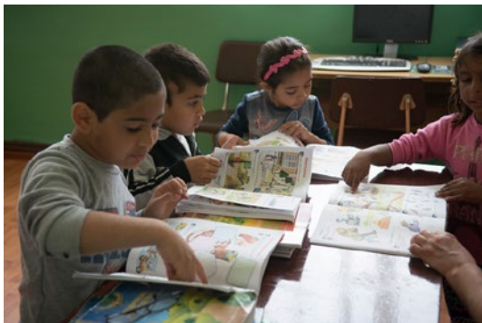
Pavlikeni – Die lokale Maßnahme konzentrierte sich auf Bildungsinitiativen, darunter die Förderung der Teilnahme an frühkindlicher Erziehung

Die derzeitigen Finanzierungsmechanismen konzentrieren sich zudem tendenziell auf messbare Leistungen und Ergebnisse, um den Erfolg der Projekte zu ermitteln und die Rechenschaftspflicht gegenüber den Gebern und den Finanzierungsmechanismen zu wahren. Allerdings sind nicht alle aussagekräftigen Ergebnisse mit quantitativen Indikatoren messbar. Es ist schwierig, wichtige Auswirkungen von partizipatorischen Prozessen und subtilere Auswirkungen wie Befähigung und Veränderungen im sozialen Gefüge der Gemeinschaften zu erfassen. Dies ist auch im Allgemeinen in Projektbewertungen nicht enthalten. Der Wert der Umsetzung partizipatorischer Ansätze läuft Gefahr, verloren zu gehen, wenn er in den formalen Projektberichtmechanismen nicht berücksichtigt wird.