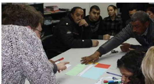
Stara Zagora – Einwohner des Stadtteils Lozenetz erörtern ihren idealen Bau- und Einrichtungsplan eines Modellhauses bei einer Fokusgruppendifkussion im Februar 2016

Gemeinschaften unbekannte „Auswärtige“ in die Gemeinschaften kommen, muss eine beträchtliche Menge an Zeit und Energie in den Aufbau und die Vertiefung von Vertrauensbeziehungen investiert werden. In Ortschaften, in denen die Inklusionsbemühungen von bereits vertrauten Personen umgesetzt werden und auf bestehenden Netzwerken und Vertrauensbeziehungen aufbauen, sind sie in der Lage, Aktivitäten innerhalb kürzerer Zeit zu organisieren sowie intensiver und partizipativer mit den Menschen zusammenzuarbeiten. Das Erzielen greifbarer Veränderungen, die den Bedürfnissen der Gemeinschaft gerecht werden, und die transparente Arbeit an gemeinsamen Anliegen sowohl der Roma als auch der Nicht-Roma sind für die Nachhaltigkeit des Vertrauens und der Beteiligung ebenfalls von wesentlicher Bedeutung.