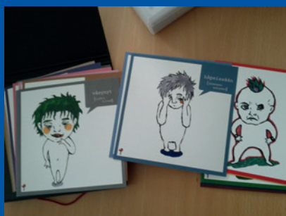
Финландия, Куовола. Материали, използвани по време на изслушвания на деца в зависимост от възрастта и развитието им.