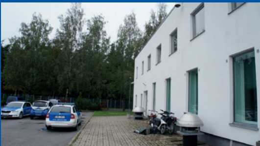
Естония. Отделен вход в задната част на сградата на Центъра за подкрепа на жертвите в Тартумаа.

Центърът за подкрепа на жертвите в Тартумаа ( Tartumaa Ohvriabikeskus ) в Естония е предвидил отделен вход в задната част на сградата за особено травмирани деца. Някои съдебни зали във Финландия също имат отделни входове, а отделните входове и чакални са много високо ценени предимства на съдилищата в Обединеното кралство.