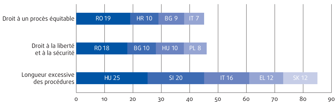
Figure 10.2 : Dispositions de la CEDH les plus fréquemment violées

Notes : Le tableau couvre les arrêts de la CouEDH depuis 2013.