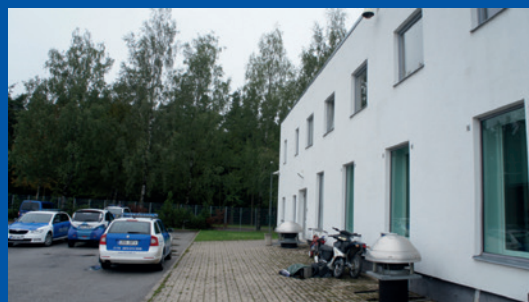
Estonija. Zaseban ulaz u stražnjem dijelu zgrade u Centru za potporu žrtvama Tartumaa.

Centar za potporu žrtvama Tartumaa ( Tartumaa Ohvriabikeskus ) u Estoniji napravio je zaseban ulaz u stražnjem dijelu zgrade za posebno traumatiziranu djecu. Neke sudnice u Finskoj također imaju zasebne ulaze, a zasebni ulazi i čekaonice elementi su kojima se pridaje veliko značenje i u sudovima u Ujedinjenoj Kraljevini.