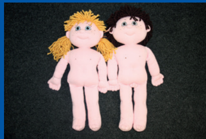
Tallinn, Estonija. Lutke koje se upotrebljavaju tijekom saslušanja djece.