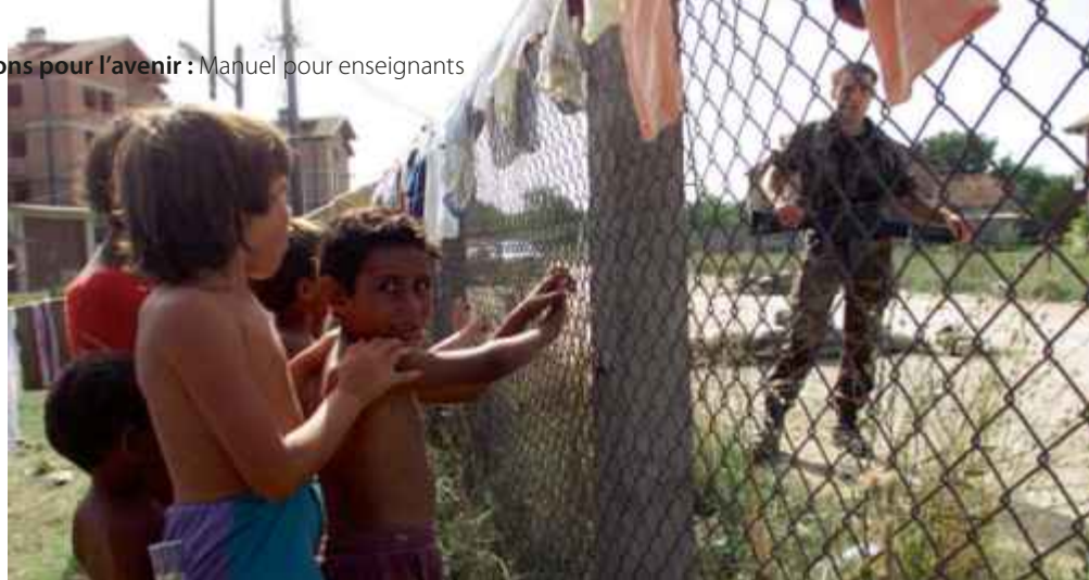
Des Roms, accusés de collaboration avec les Serbes pendant la guerre dans les Balkans, sont protégés par des casques bleus de l'ONU dans un campement grillagé à cause de harcèlement par des Albanais, Djakovica Kosovo 1999.