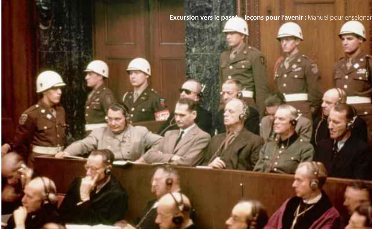
Les procès de Nuremberg entre 1945 et 1949 marquèrent un tournant dans la communauté internationale dans la poursuite de crimes contre l'humanité.