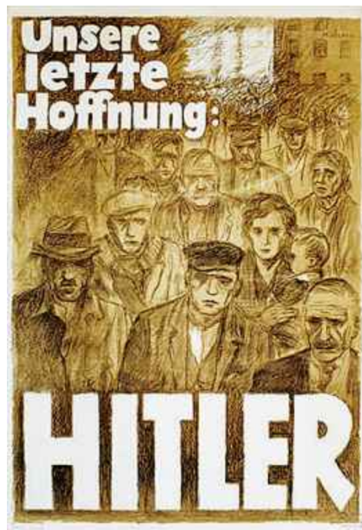
« Notre dernier espoir : Hitler » Lors des élections présidentielles de 1932, la propagande nazie fait appel à des Allemands au chômage et démunis par la Grande Dépression.

La conférence de Paris aborda longuement le droit des minorités, notamment leur droit à l'existence, à la liberté de conscience et de religion, à avoir la nationalité de leur lieu de résidence, à l'égalité avec les autres groupes ethniques du pays, et à l'exercice des libertés civiques et politiques. Mais l'effet principal du traité de Versailles fut de punir sévèrement l'Allemagne, qui le signa non sans protester sous la contrainte de la défaite.