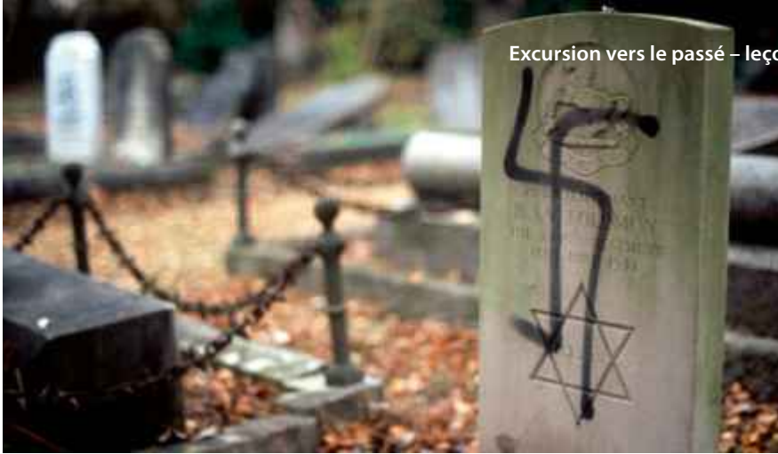
Pierre tombale d'un soldat dans un cimetière juif, profanée et souillée de croix gammées et d'insignes fascistes par des extrémistes de droite.