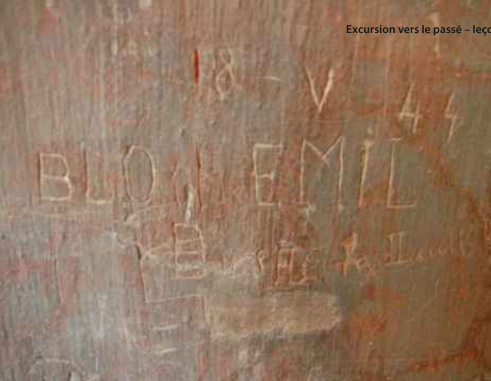
Graffiti dans le 9 e fort de Kaunas en Lituanie, gravé sur les murs de leur cellule par des Juifs déportés de Drancy, Paris, peu avant leur assassinat.