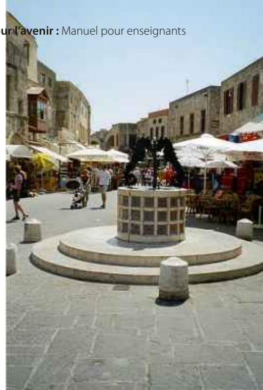
Une photo touristique de Rhodes. Rien dans l'image – ou sur le lieu – révèle qu'il s'agissait autrefois du vieux quartier juif de Rhodes.

L'exercice consiste à présenter aux élèves une photo du quartier juif de Rhodes sans leur dire où elle a été prise. En leur demandant de deviner la ville représentée, on attirera leur attention sur l'image sans dévoiler l'objectif de l'exercice pédagogique. Ils seront également invités à relever des détails et le thème général de la photo. On leur demandera ensuite de dépasser le niveau purement pictural et de formuler ce qui se cache derrière ce qui est évident.