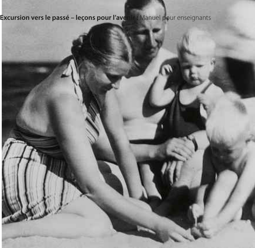
La famille Heydrich. Reinhard Heydrich était en charge du service de sécurité du Reich dans l'Allemagne nazie jusqu'à 1942 et le coresponsable de la planification de l'extermination des Juifs. Cette photo est extraite d'un album de photo privé.