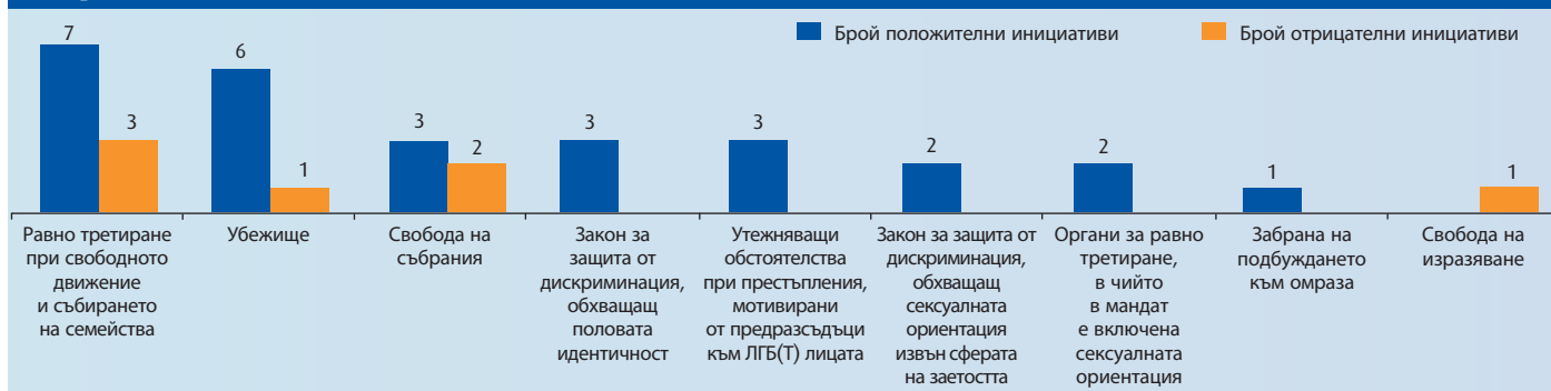
Фигура 1: Области, засегнати в най-голяма степен от правните развия през периода 2008—2010 г.

Фигура 1 показва, че областта, която е засегната в най-голяма степен както от положителни, така и от отрицателни правни промени, е равното третиране на хомосексуалните двойки при свободното движение и събирането на семейството. Други области, в които се наблюдават до голяма степен положителните правни промени, са свързани с правото на убежище и правото на събирания, които също показват и отрицателни практики, както и разясняване на защитата на транссексуалните лица съгласно закона за защита от дискриминацията. Установени са положителни тенденции по отношение разширяване обхвата на закона за защита от дискриминацията извън сферата на заетостта, разширяване мандата на органите за равно третиране и наказателното право. Една отрицателна промяна се наблюдава при свободата на изразяване.