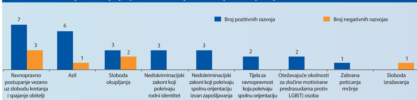
Slika 1: Područja na koja je pravni razvoj imao najviše utjecaja, 2008. – 2010.

Slika 1. pokazuje da je područje na koje najviše utječu i pozitivne i negativne pravne promjene ravnopravno postupanje prema istospolnim partnerima u slobodi kretanja i spajanju obitelji. Druga područja na koje najviše utječu pozitivne pravne promjene vezana su uz azil i slobodu okupljanja, koje također karakteriziraju negativne prakse, i pojašnjenje zaštite za transrodne osobe pod zakonima protiv diskriminacije. Pozitivni trendovi identificirani su u proširivanju zakona protiv diskriminacije izvan područja zapošljavanja, mandata tijela za ravnopravnost i kaznenog zakona. Jedan negativni trend vezan je uz slobodu izražavanja.