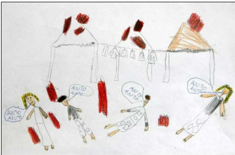
Dessins d'enfants inspirés par les événements de Ponticelli («au secours, au secours») 12

Le 13 mai, dans l'après-midi, de 300 à 400 habitants du quartier menés par des femmes ont attaqué l'un des plus grands campements roms du voisinage, qui abritait 48 familles. Armés de barres de métal et de bois, les attaquants ont réussi à abattre la clôture métallique. Une fois à l'intérieur du campement, ils se sont mis à crier des insultes et des menaces, ont jeté des pierres sur les cabanes et les caravanes et ont retourné quelques voitures. À peu près au même moment, un bâtiment abandonné, qui seulement deux jours auparavant abritait six familles roms, a été incendié. Dans deux incidents distincts survenus le même jour, deux jeunes garçons roms ont été attaqués par une bande de garçons du quartier, et un petit pick-up appartenant à un Rom a été incendié. 10 Deux femmes roms ont été harcelées et chassées d'un supermarché proche de l'un des grands campements, alors qu'elles faisaient leurs courses. 11