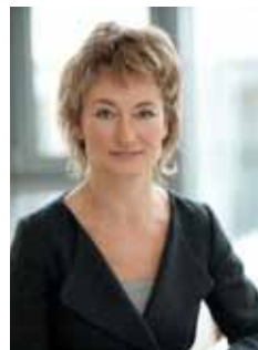
Ilze Brands Kehris Председател на управителния съвет