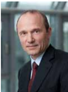
Morten Kjærum igazgató

Ezen örökség ellenére azonban még mindig számos olyan kihívással szembesülünk, amelyek megakadályozzák az alapvető jogok gyakorlatba való teljes átültetését. A FRA az EU területén végzett adatgyűjtéssel és elemzéssel segíti az Európai Unió intézményeit és tagállamait e kihívások felismerésében és kezelésében. Ügynökségünk az uniós intézményekkel, tagállamokkal és egyéb nemzetközi, európai és nemzeti szervezetekkel együttműködve kiemelkedő szerepet játszik abban, hogy az alapvető jogok az Európai Unió valamennyi lakója számára biztosítva legyenek.