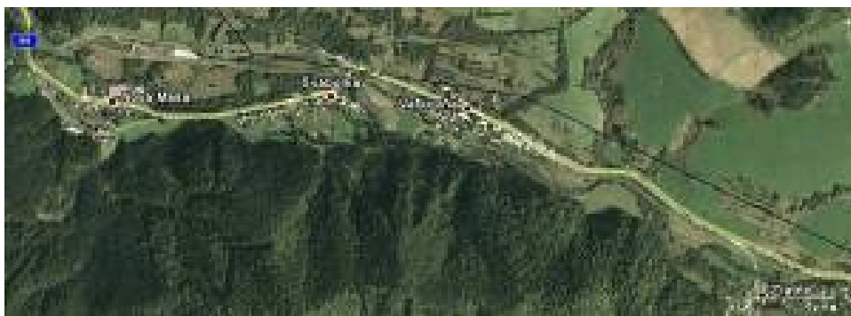
Obrázok č. 2 – Obec Vaľkovňa