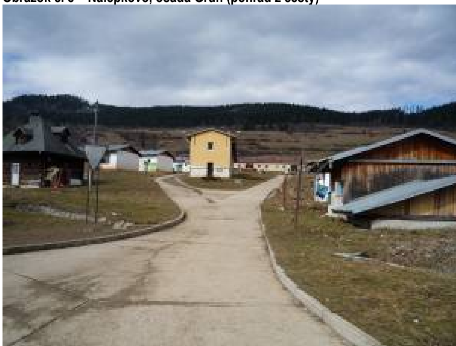
Obrázok č. 8 – Nálepkovo, osada Grün (pohľad z cesty)