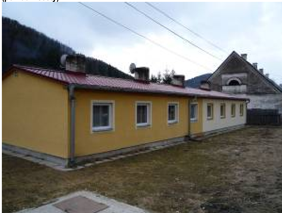
Obrázok č. 4 – Vaľkovňa, priestory na bývanie postavené v rámci projektu (pohľad z cesty)