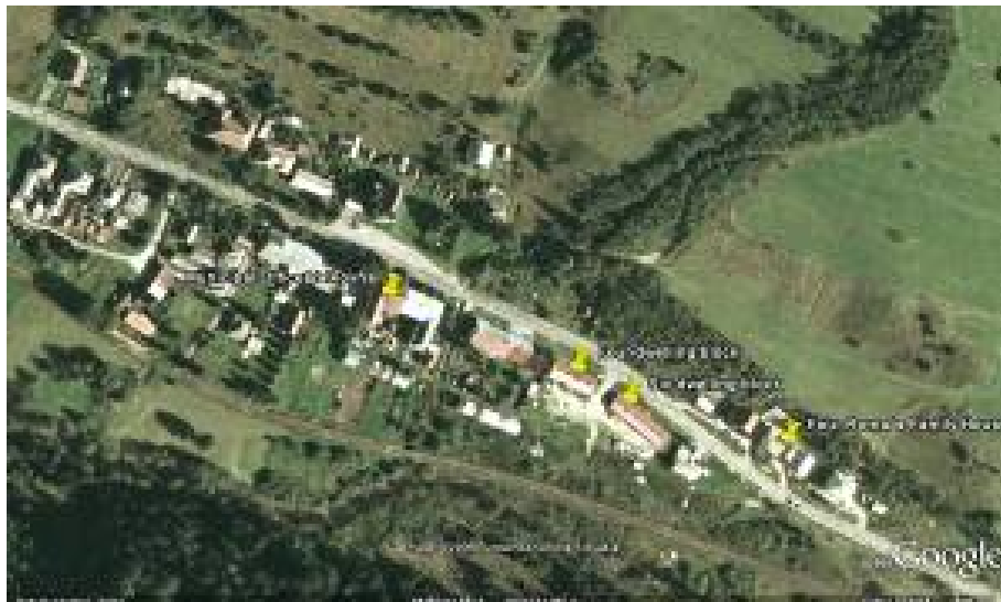
Obrázok č. 3 – Osada Vaľkovňa