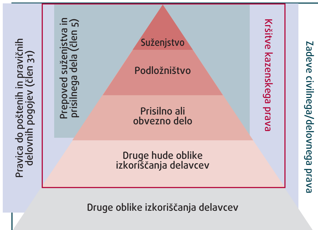
Prikaz 1: Oblike in resnost izkoriščanja delavcev

Opombe: Žrtve vseh vrst izkoriščanja, navedene v tem prikazu, so lahko tudi žrtve trgovine z ljudmi, kadar koli so izpolnjeni elementi opredelitve trgovine z ljudmi iz člena 2 direktive o boju proti trgovini z ljudmi, ki so zajeti v zakonodajo države članice.