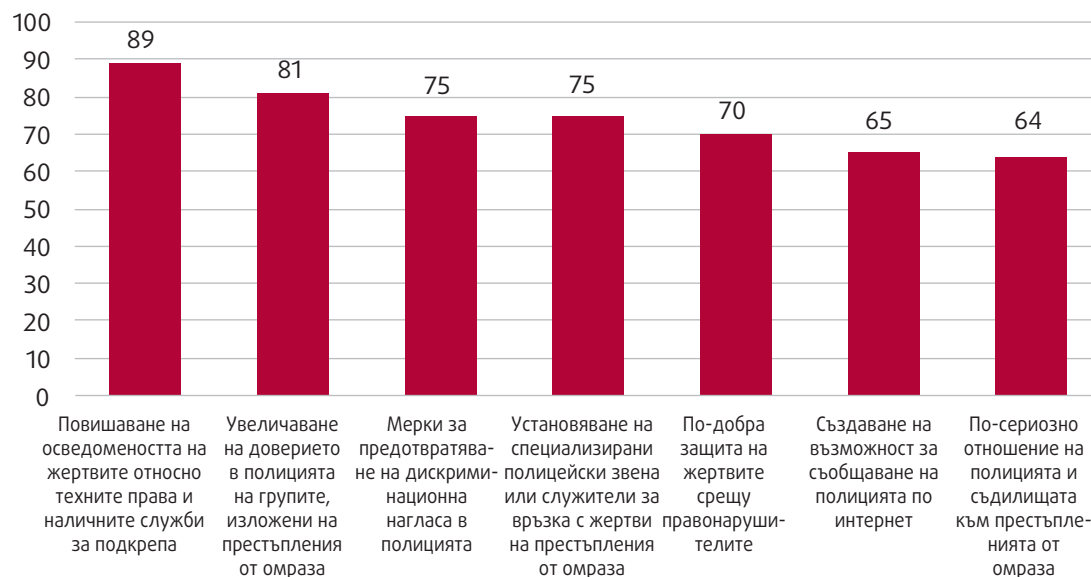
Фигура 2: Гледни точки на интервюираните експерти от всички професионални групи относно факторите, за които може да се предположи, че ще доведат до увеличение на броя на жертвите, обърнали се към полицията (N=263, процент от всички отговори)

Въпрос: Посочете кои от следните мерки ще направят по-лесно за жертвите на престъпления, подтикнати от предубеждения, да съобщават на полицията и по този начин да доведат до увеличаване на броя на жертвите на престъпления, подтикнати от предубеждения, които съобщават на полицията. Възможен е повече от един отговор.