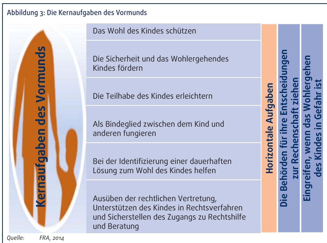
Abbildung 3: Die Kernaufgaben des Vormunds

das Wohl des Kindes zu schützen und zu fördern. Bei jeder das Kind betreffenden Entscheidung muss der Vormund die Möglichkeit unterstützen, die im Wohl des Kindes liegt. Der Vormund muss sicherstellen, dass die Ansichten des Kindes gehört werden und ihnen gebührend Aufmerksamkeit geschenkt wird. Der Vormund muss das Kind unter Berücksichtigung seiner Reife und seines Entwicklungsstands über Aspekte seiner Arbeit informieren und es mit einbeziehen.