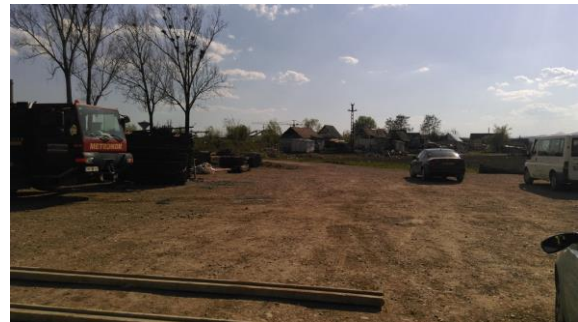
Proximitatea proiectului de infrastructură (autostrada internațională) față de construcțiile din Bufa – aproximativ 15-20m distanță

O altă sursă de îngrijorare pentru comunitatea locală este constituită de construcția unui tronson de autostradă (Sebeș-Turda) în proximitatea zonelor Bufa și Poligon. Rezidenții din cele două comunități sunt preocupați de modul în care acest proiect de infrastructură le va afecta locuințele și accesul la ele.