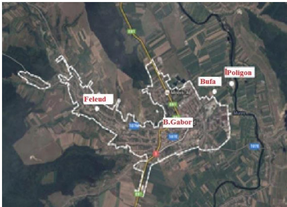
Hartă cu așezările romilor din Aiud

concretă care ar putea sprijini îmbunătățirea situației romilor din diferitele zone ale orașului. Acesta nu prevede totodată finanțarea acțiunilor potențiale care ar susține asigurarea nevoilor de locuit ale romilor. Locuirea este unul dintre obiectivele generale ale acestei strategii, îmbunătățirea condițiilor de locuit și accesul la utilități fiind unele dintre obiectivele planificate pentru perioada 2014-2020, alături de asigurarea accesului la locuințe sociale chiriașilor evacuați.